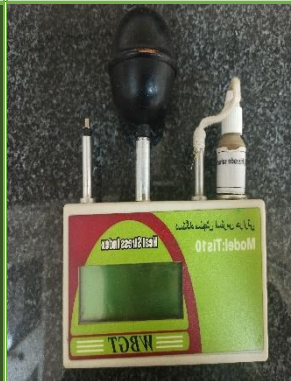
دستگاه سنجش دمای تر گوی سان مدل TIS10