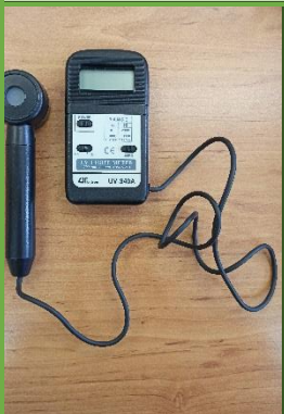
دستگاه سنجش UV مدل Lutron UVA 340A-& UVB