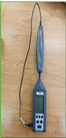
صداسنج مدل KIMO DBA