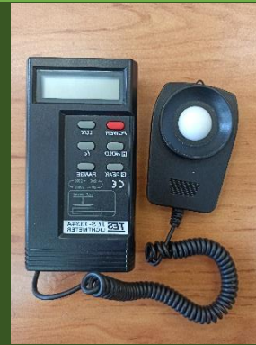
نورسنج مدل TES 1334A