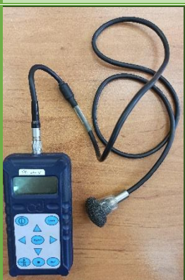
نویز دوزیمتر مدل CEL320/360