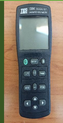
دستگاه اندازه گیری میدان های الکترومغناطیس مدل TES-1394