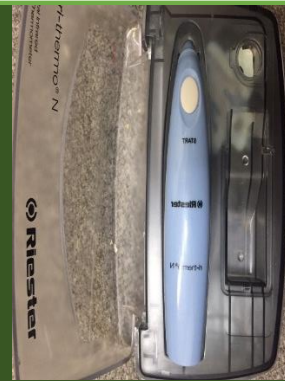
دماسنج پرده صماخ گوش مدل Riester