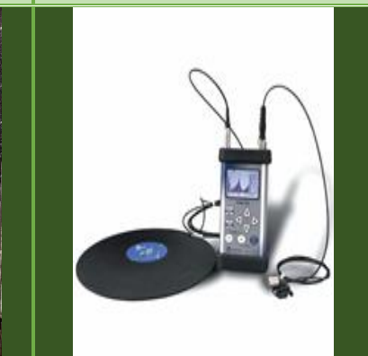
ارتعاش سنج تمام بدن مدل SVANTEK 958