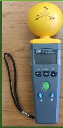
دستگاه اندازه گیری میدان های الکترومغناطیس مدل TES92