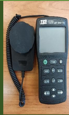
نورسنج مدل TES 1339