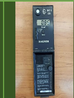
دستگاه سنجش IR مدل Hagner IR-EC1