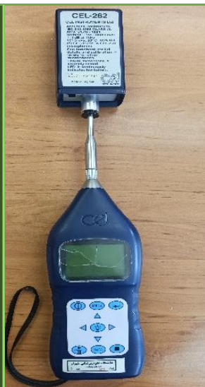
صداسنج مدل Casella Cel- 440