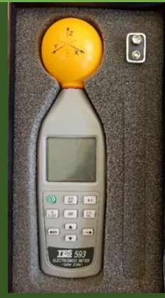
دستگاه اندازه گیری میدان های الکترومغناطیس مدل TES593