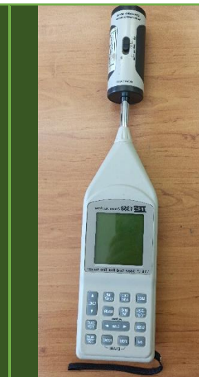
صداسنج مدل TES-1358