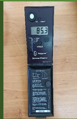
لوکس متر مدل EC-1