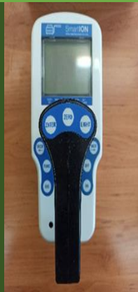
دستگاه سنجش اشعه های یونیزان (آلفا، بتا و گاما) مدل Smart ION Meter E0001385