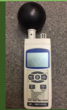
دستگاه سنجش دمای تر گوی سان مدل SD Lutron 2010