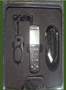
رنگ سنج نور مدل TES-136