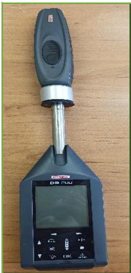
صداسنج مدل KIMO BD-200