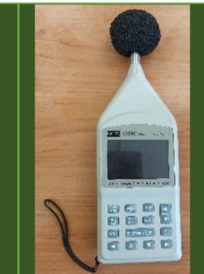
صداسنج مدل TES-1358C