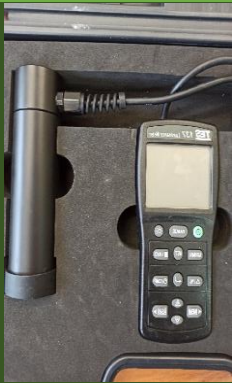
درخشندگی سنج مدل TES 137