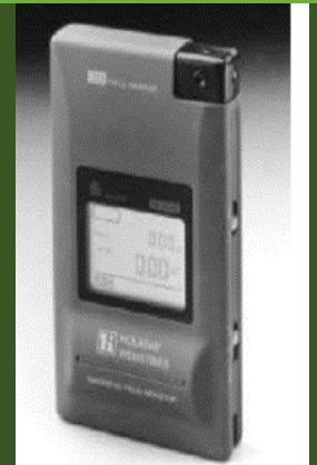
دستگاه اندازه گیری میدان مغناطیسی مدل HI-3550