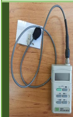
نویز دوزیمتر مدل TES 1354