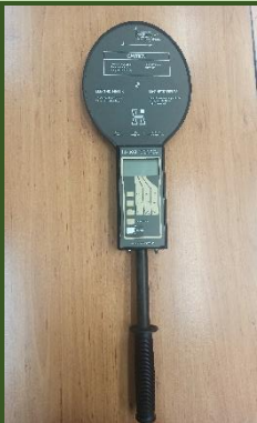
دستگاه سنجش میدان های الکتریکی و مغناطیسی مدل HI- 3604