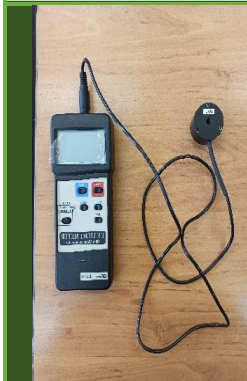
دستگاه سنجش UV مدل Lutron UVC 254