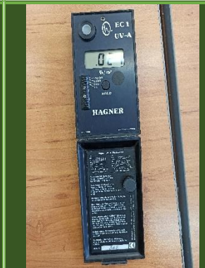
دستگاه سنجش UV-A مدل Hagner