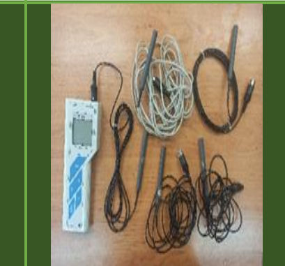
دستگاه سنجش UV، IR LUX مدل 666 230