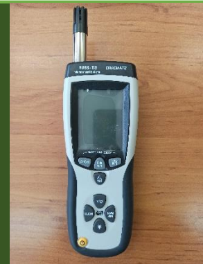
ترومتر مدل ST8869